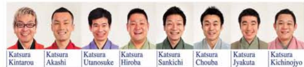
Katsura Kintarou Katsura Akashi Katsura Utanosuke Katsura Hiroba Katsura Sankichi Katsura Chouba Katsura Jyakuta Katsura Kichinojo

由单口相声演员作向导，有趣的话语定会让您在了解大阪的同时笑声不段。您会看到像巴拿马运河一样的水闸，还有很多非常低矮的桥，大阪市中央公会堂的彩灯及道顿堀的那些耀眼的霓虹灯，大阪著名的旅游名胜处很多！那么，您也来发现寻觅新的大阪吧！