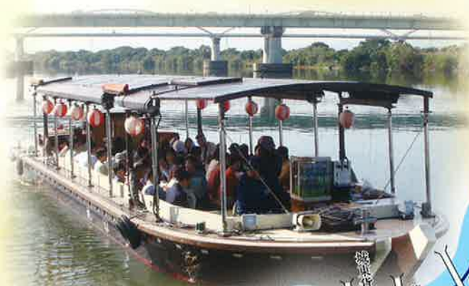
屋形船風遊覧船「えびす」