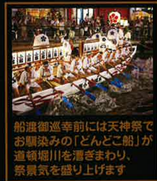
船渡御巡幸前には天神祭でお馴染みの「どんどこ船」が道頓堀川を漕ぎまわり、祭景気を盛り上げます

難波八阪神社船渡御行事は江戸時代、天神祭(大阪天満宮)と並んで盛大におこなわれていたと伝わっています。江戸中期以降、その船渡御も途絶えてしまいましたが、2001年に氏子衆と地元企業・団体の支援と熱意で230年振りに復活しました。