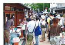
くわんか五六市のにぎわい