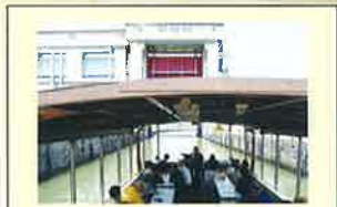
けまこうもん 毛馬閘門

閘門は新旧淀川の水位差を調節して、船の航行を助けるもので、昭和52(1977)年に現在の閘門が設置されました。