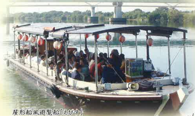
屋形船風遊覧船「いっぴんす」