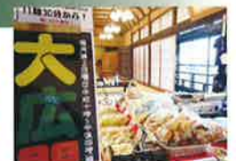
鍵屋資料館大広間茶屋