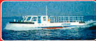
一本松海運鴻運丸