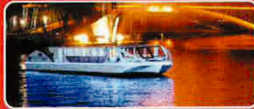
電気船 あまのかわ