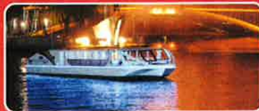
電気船 あまのかわ