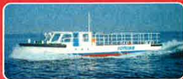
一本松海運鴻運丸